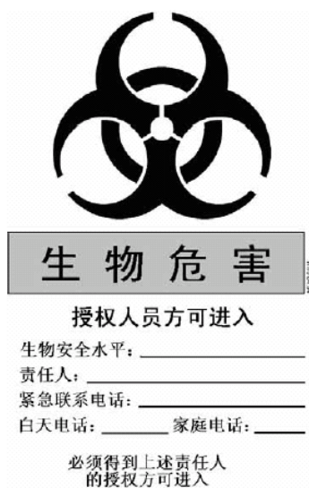
图1. 张贴于实验室门上的生物危害警告标志

4.1.1 在处理危险度 2 级或更高危险度级别的微生物时，在实验室门上应标有国际通用的生物危害警告标志（图1）。